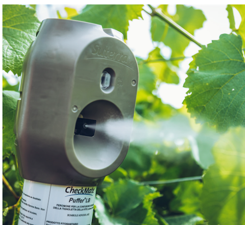
PUFFER (diffusore attivo)