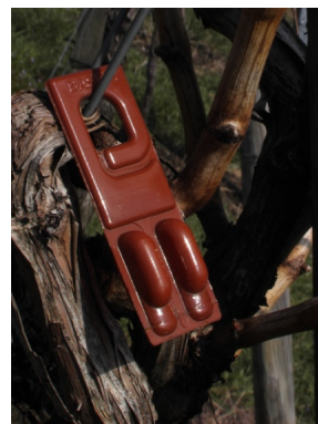
RAK 2 MAX