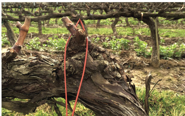
ISONET L TT

Attualmente esistono in commercio 3 tipologie di diffusori: 2 passivi ed 1 attivo